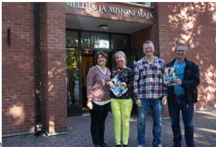
Billedtekst: På besøk hos Plussmedia i Estland

I løpet av våren deltar konfirmanter på ulike aktiviteter for å samle inn penger til dette arbeidet. I februar gjorde konfirmanter en flott innsats med et