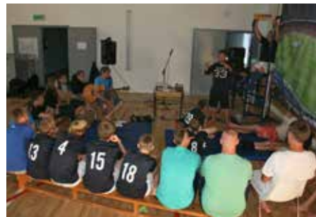
Billedtekst: Andaktspause i fotballkampen.

lite lotteri som gav god gevinst. Og i mai skal vi ha en aksjonsdag med ulike morsomme aktiviteter og oppsummering av hvor mye vi har fått samlet inn. Hovedaksjonen blir en bøsseinnsamling tirsdag 17. april . Da kommer konfirmanter til å gå fra dør til dør med bøsser til inntekt for konfirmantprosjektet. Vi håper de blir tatt godt imot.