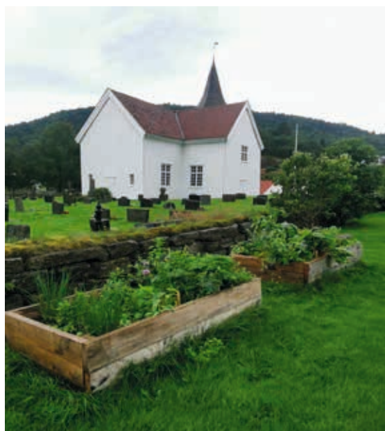
Bildet under: Slik så urtekassene ut i 2024.

Det blir opplegg som de siste årene 26. april med plantesalg og veiledning ute på den store plenen. Samtidig steikes og selges det «prostelapper» og kaffe. Bakerovnen i